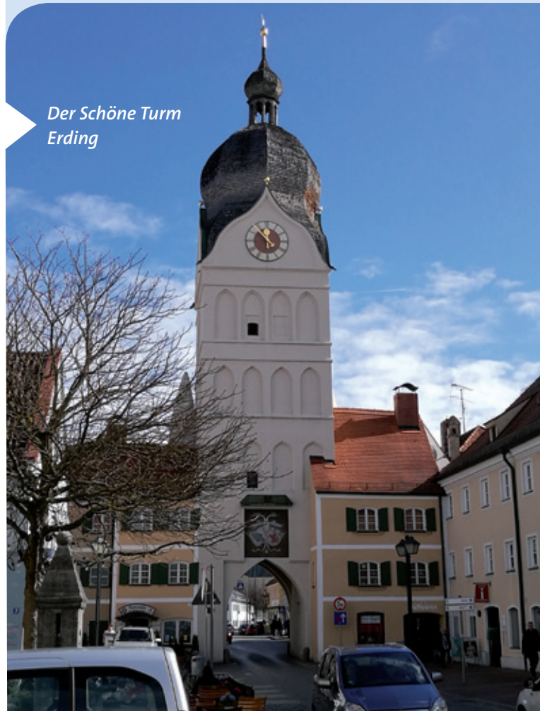
Der Schöne Turm Erding